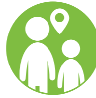
الخصائص الديموغرافية والهجرة

من الجدير ذكره أن هذه الخطة وأولوياتها تنسجم مع أهداف التنمية المستدامة السبعة عشر كما التزمت الدولة اللبنانية بتحقيقها. بعد ما تم إقرارها في مجلس الوزراء، ستتطلب المرحلة التالية من تفعيل خطة العمل نقاشها في اللجان النيابية (في لجنة الشباب والرياضة) ومن ثم تقديمها لمجلس النواب.