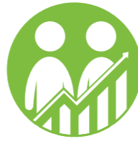
العمالة والمشاركة الاقتصادية