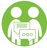
الاندماج الاجتماعي والمشاركة السياسية