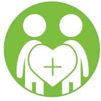
الصحة والسلوكيات البالغة الخطورة

وتغطي هذه التدخلات قطاعات السياسة الخمسة ذات الأولوية: