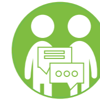
الاندماج الاجتماعي والمشاركة السياسية