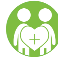
الصحة والسلوكيات البالغة الخطورة