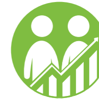
العمالة والمشاركة الاقتصادية